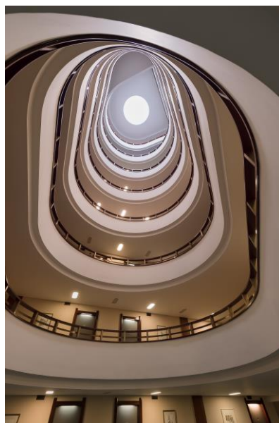
Notranje stopnišče uHotela.

V skladu s to poslovno strategijo se bo Grand hotel Union Business na Miklošičevi cesti 3 odslej predstavljal in tržil pod blagovno znamko uHotel, ki nakazuje dediščino Union hotelov, samo vizualno podobo novega znaka pa je navdihnilo arhitekturno zelo značilno notranje stopnišče v obliki črke u. Obsežen projekt prenove blagovne znamke celotne hotelske skupine in posameznih hotelov zaokrožuje lansiranje nove spletne strani www.uhcollection.si .