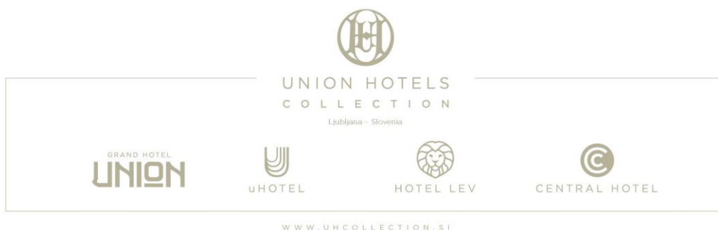
Nova celostna grafična zasnova Union Hotels Collection.

»Korporativna blagovna znamka Union Hotels Collection poudarja predvsem zgodovino in tradicijo odličnosti na ravni skupine. Beseda 'collection' pa nakazuje, da gre za zbirko štirih unikatnih ljubljanskih hotelov, za katere smo strateško razvili ponudbo in specifične trženjske nastope, vključno z zgodbo blagovne znamke vsakega hotela, pozicioniranjem, ciljnim skupinami in trženjskimi aktivnostmi. Sestavni del te prenove sta tudi nova celostna grafična podoba na ravni skupine in posameznih hotelov, ki je plod našega internega znanja, ter povsem nova spletna stran,« je povedal Matej Rigelnik, glavni izvršni direktor Union hotelov d. d.