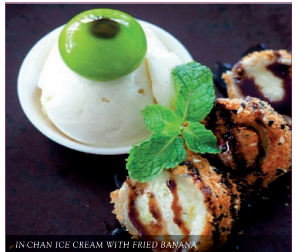
IN-CHAN ICE CREAM WITH FRIED BANANA