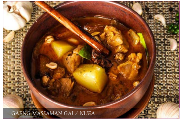
GAENG MASSAMAN GAI / NUEA 220/280 chicken or beef shank curry