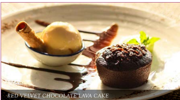
RED VELVET CHOCOLATE LAVA CAKE