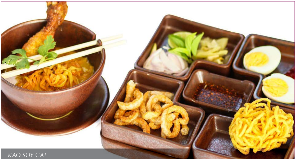
KAO SOY GAI