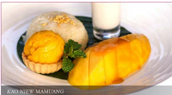
KAO NIEW MAMUANG