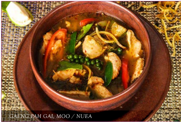
GAENG PAH GAI / MOO 🐷 220/280 / NUEA 🌶️🌶️

country-style curry with chicken, pork or beef แกงป่าไก่ หมู หรือเนื้อ