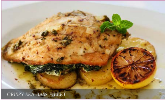
CRISPY SEA BASS FILLET